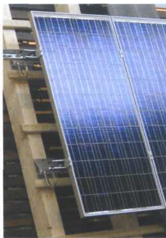
Das neue Montagesystem MHHnovotegra im Einsatz. Die Eindeckung der Dachziegel steht noch an

Die Tübinger MHH Solartechnik GmbH hat ihr bestehendes Montagesystem MHHalutegra weiterentwickelt. Dabei wurde die Klemmtechnik beibehalten und in der Ausführung vereinfacht. Das Ergebnis heißt